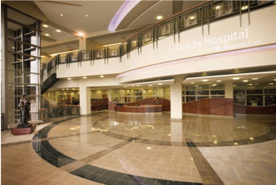
Lakeside Hospital, la Facilidad de Alegent Health dónde FBG ofrece servicios de limpieza.

Alegent Health es la mayor organización sin fines de lucro, basada en la fe en el sistema sanitario y el suroeste de Iowa, Nebraska. La organización de 10 hospitales, más de 100 sitios de servicio, más de 1,300 médicos de personal médico y 9,000 empleados.