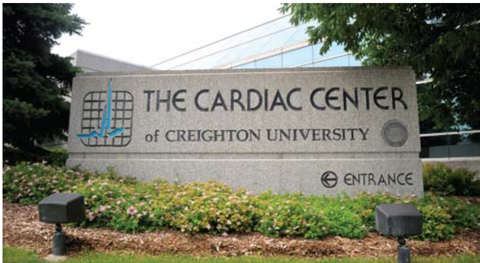
El Cardiac Center es una de las muchas instalaciones donde los Asociados Medicos de Creighton brindan atención a los pacientes en el area metropolitana de Omaha.

FBG presta servicios de limpieza a seis clínicas de Medicina Familiar de Creighton y a dos clínicas de Obstetricia/Ginecología a lo largo de gran parte de Omaha, más las instalaciones de Servicios Médicos de Emergencia y el Cardiac Center de Creighton ubicado en campus centro de la Universidad.